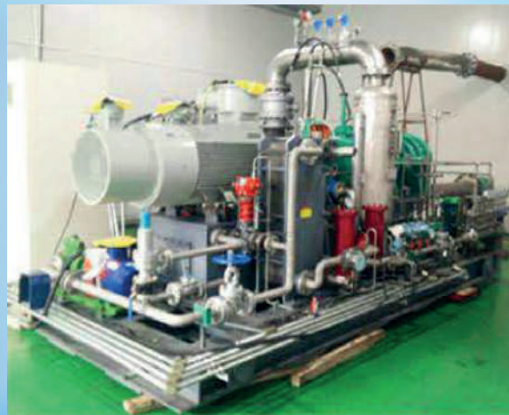
Turbo Compresor Centrífugo