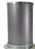
Filtros de aire, de aceite y separadores de aire/aceite