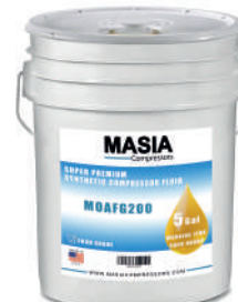
Lubricantes sintéticos & semisintéticos