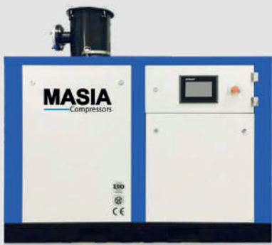
Bomba de Vacío