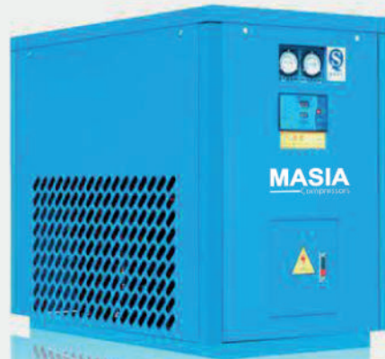
Secador de Aire