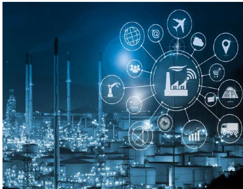
Soluciones para toda la industria

En el año 2007, se funda en los Estados Unidos la empresa Masia, en sus inicios se dedicaba a representar a las marcas más afamadas en el sector del tratamiento de aire comprimido y al sector automatización y control, sirviendo al mercado Latinoamericano desde sus oficinas en Florida. En 2014, inicia operaciones en Venezuela y cambia la orientación de sus soluciones hacia la generación y tratamiento del aire comprimido, con un capital humano con más de 30 años de experiencia en el área.