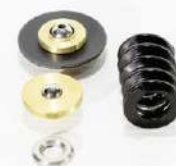
Kits de cambios, válvulas, termostatos, ring, presostato