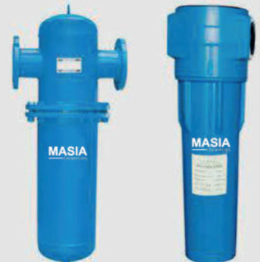
Filtro de Aire