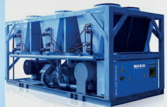
Bomba de Calor