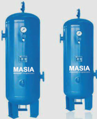
Tanque Acumulador de Aire